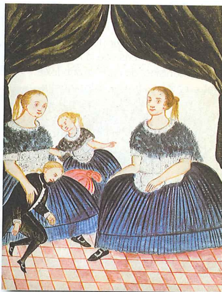
Mujeres españolas, TRUJILLO DEL PERÚ, siglo XVIII, Madrid, Biblioteca del Palacio Real.

ingente información historiográfica sobre los dos primeros siglos –XVI y XVII– de presencia española en aquellas tierras. De este modo y desde el segundo viaje de Co-